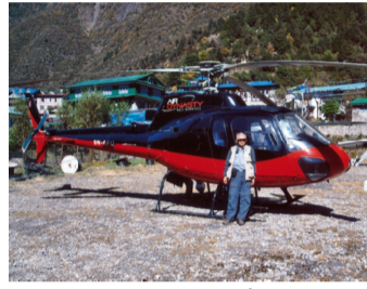
チャーターヘリコプター