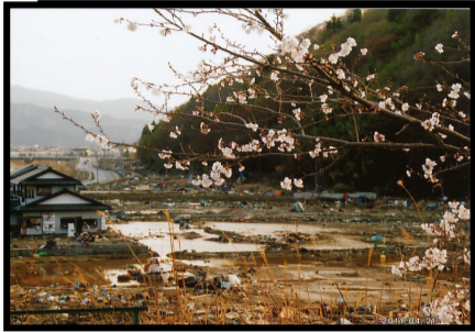
北上の桜

太平洋写真学校北上教室被災状況と協力依頼 当協会も協賛してまず太平洋写真学校北上教室を主宰している、宮城県石巻市北上総合支所は今回の震災で壊滅的な被害に遭いました。支所職員の半