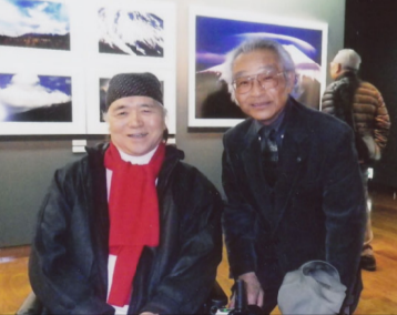
出版芸術社(3800円) 書店で販売中です。