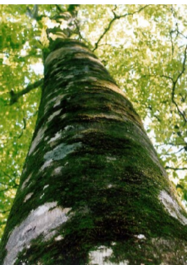
白神のブナ ミニ二神コース (小松金吾)