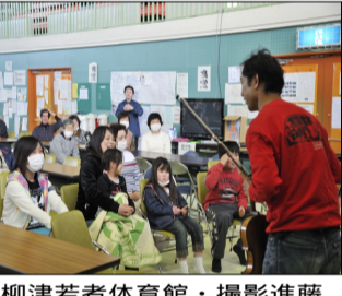
柳津若者体育館