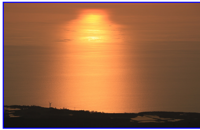
「鳥海山よりの荘厳な落日」 撮影旅行参考作品

会員の皆様におかれましても、ウイルス撲滅は難しくあなたのすぐ近くにいるかも知れません。