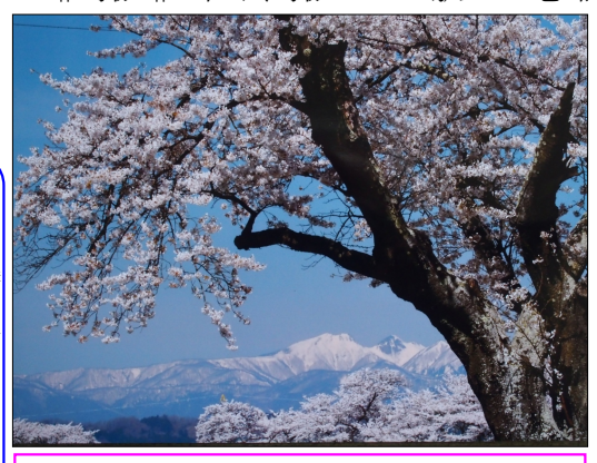
作例 2、船岡の古木を前景に取り入れて、ボリューム感を出した。

1：「染井吉野」人工種で身近に多くありますが、一般的に色が薄く花の色を出すのが一番難しい品種です。光を読んで順光線を選び、逆逆光を選んで白飛びを防ぐ。 PLフィルターで余分な光をカットしてグラデーションを整える。 2：「エドヒガン」「紅枝垂れ」「山さくら」色