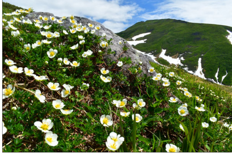
霊峰に咲く 茂庭 宣元