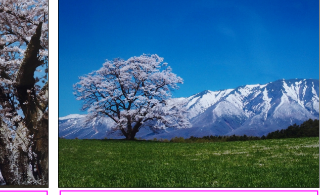
作例 1、雫石一本さくら・背景に岩手山を取り入れて、スケールを出した。

綺麗な、説明的に写す。 2：作品的な撮り方を捨てる。 ●さくらの撮影地 ・公共交通機関利用コース 1：大河原千本さくら・船岡のさくら JR東北線、仙台駅上り普通電車利用 仙台駅⇨船岡駅⇨船岡側堤防、さくらの古木、蔵王を背景に撮影⇨船岡城址公園園内桜と千本桜展望、撮影⇨大河原千本桜撮影⇨大河原駅⇨仙台駅