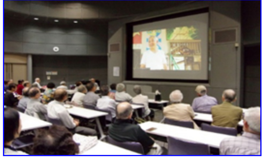
2019年10月1日 日立システムズホール仙台・エッグホールにて