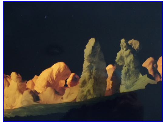
作例写真 月光の樹氷をライトアップをイメージして地味に加工しました。

正に留めた、明暗、コントラスト、少々のトリミングに限ると良いでしょう。この範囲であればコンテストもOKです。加工した写真「アート写真」OKのコンテストペーパーメーカーのピクトリコ・エプソン、他アート部門のあるコンテストも多くなっています。応募規定を確認して下さい。