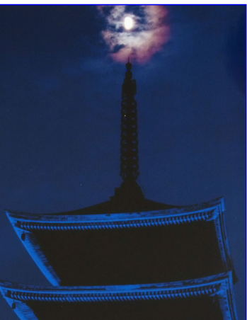
作例写真：定義山の五重塔のライトアップ

編集後記 ▼東風季報は今号よりお知らせが中心の内容になりました。ご投稿記事は掲載いたしますので可能な方は是非お願いたします。 ▼お知り合いの方への当会への入会お声がけも、よろしくお願いたします。