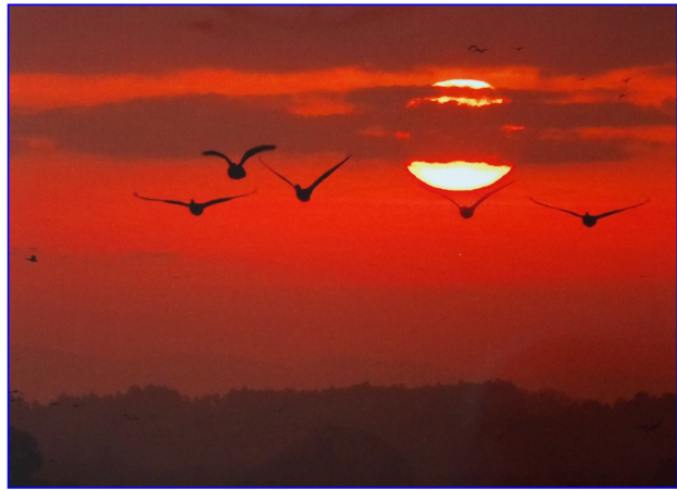
作例写真：伊豆沼の早朝ガンの飛揚