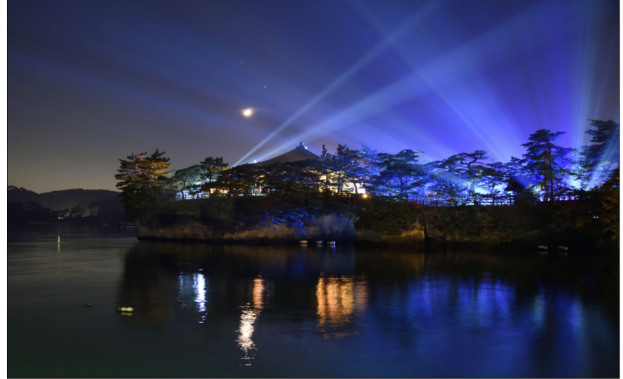
光に浮かぶ五大堂 浅野功