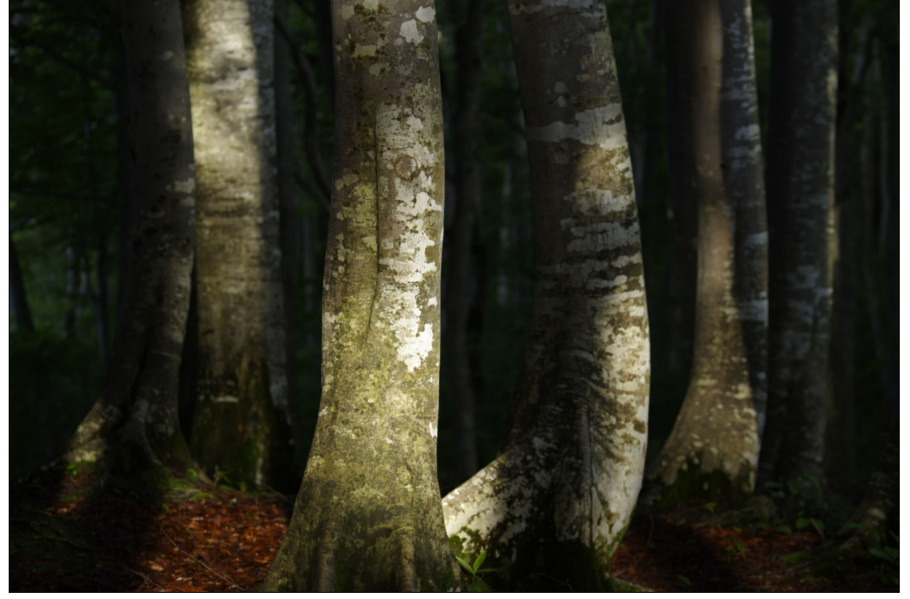
一人静かに 南 正一