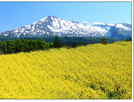
桃野の菜の花と鳥海山

「鳥海山撮影ツアー」は当初の予定通り開催されました。 実施日：令和5年5月30日(火)～31日(水)